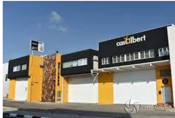
Fotografía: Sede de Aceites Albert

con una capacidad de embotellado de 200.000 litros al día y una capacidad de almacenamiento de 600.000 litros.